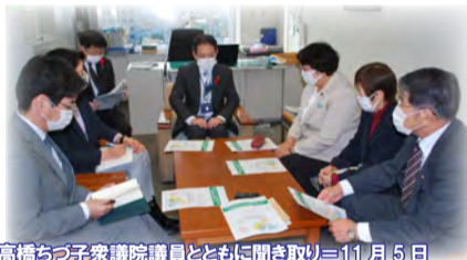
高橋ちづ子衆議院議員とともに聞き取り＝11月5日

議会終了後、コロナ陽性者が200人を超える緊急事態に直面しました。日本共産党青森県議団は10月22日、弘前市の飲食店街でPCR検査を集中して実施することなどを申し入れ(写真上)。また11月5日、高橋ちづ子衆議院議員とともに県から国への要望の聞き取りを行いました(写真下)。