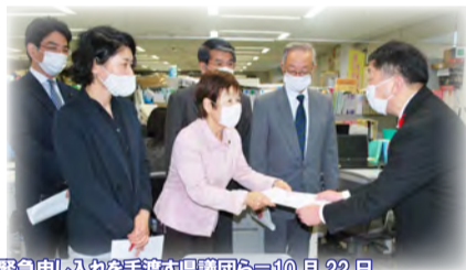
緊急申し入れを主導する県議団ら＝10月22日