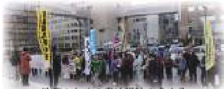
改憲のための憲法論議を求める 意見書採択を受け、 開催された抗議集会＝3月23日、青森市

自民党などが、憲法審査会での憲法論議を求める意見書を提出し可決しました。改憲のために設置された憲法審査会での議論を促すことは看過できません。日本共産党など3会派が反対しました。