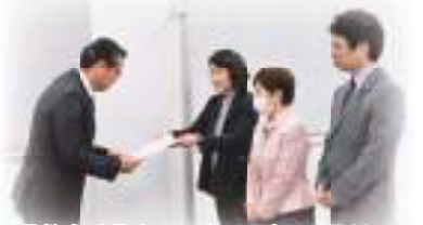
県教育委員会への申し入れ=2月28日

安倍首相がいっせい休校要請をした翌2月28日、県教委に対し、「子どもたちの健康と安全を最優先に、実情に即した丁寧な対応を」と申し入れを行いました(写真)。